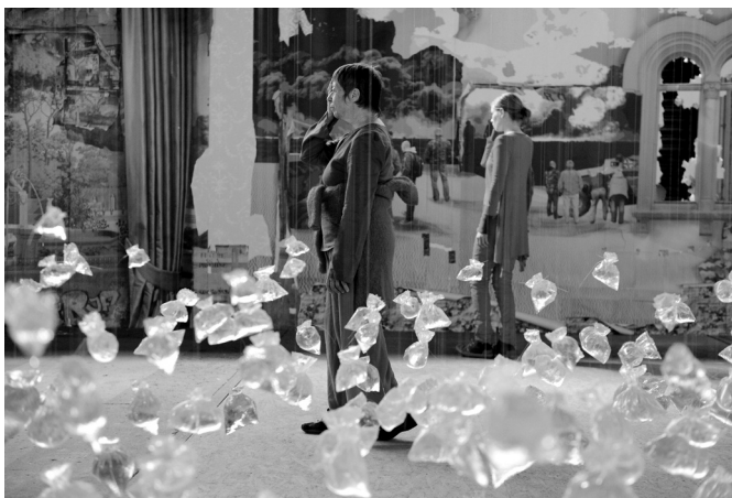
Auftritt bei der Eröffnung des Bremer Kunstfrühlings 2014

„Es ist die Achtsamkeit im Augenblick, die Konzentration, das offen werden für kreative Impulse des eigenen Körpers, was mich an unseren Performances immer wieder neu fasziniert!“ beschreibt eine Akteurin von tanzwerk bremen ihre Freude am performen und improvisieren. Für ihre tänzerischen Performances sucht die Gruppe von tanzwerk bremen unter Leitung von Rolf Hammes besondere Räume, besondere Orte, besondere Anlässe auf, um sich diesem Prozess tanzend zu widmen.